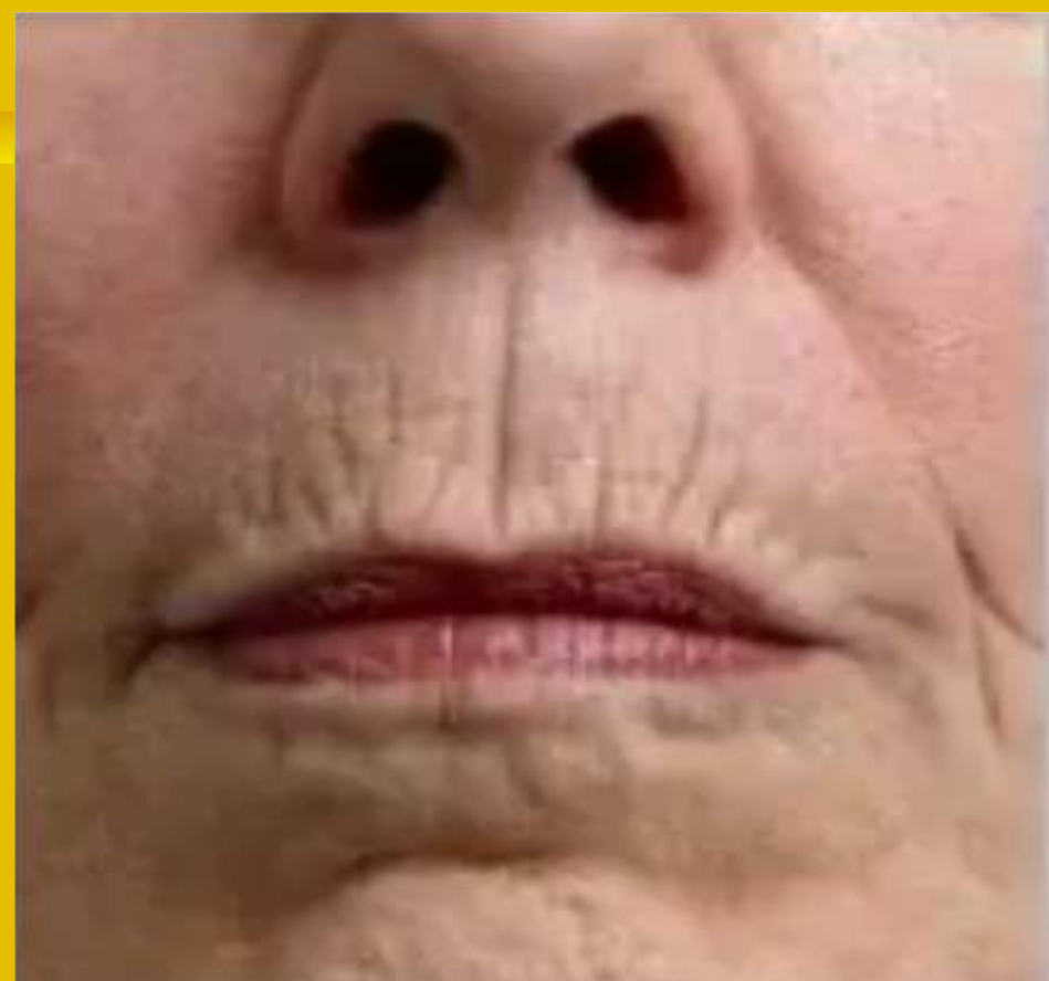
CÓDIGO DE BARRAS